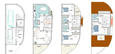
PLANTA BORDO 100.00 m 2 (1070 sq ft) 100.00 m 2 (1070 sq ft) 100.00 m 2 (1070 sq ft) PLANTA ALBA 100.00 m 2 (1070 sq ft) 100.00 m 2 (1070 sq ft) 100.00 m 2 (1070 sq ft) PLANTA ALTA 100.00 m 2 (1070 sq ft) 100.00 m 2 (1070 sq ft) 100.00 m 2 (1070 sq ft) PLANTA BAJA CUBIERTA 100.00 m 2 (1070 sq ft) 100.00 m 2 (1070 sq ft) 100.00 m 2 (1070 sq ft)