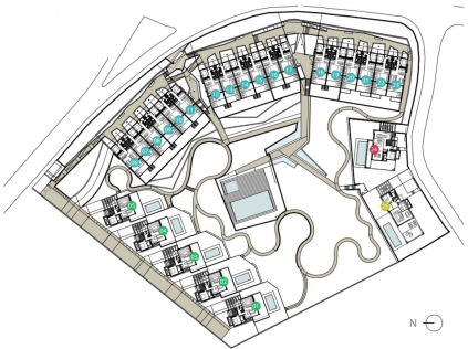
3 Bedroom Townhouse at La Vera de Marbella, Elviria